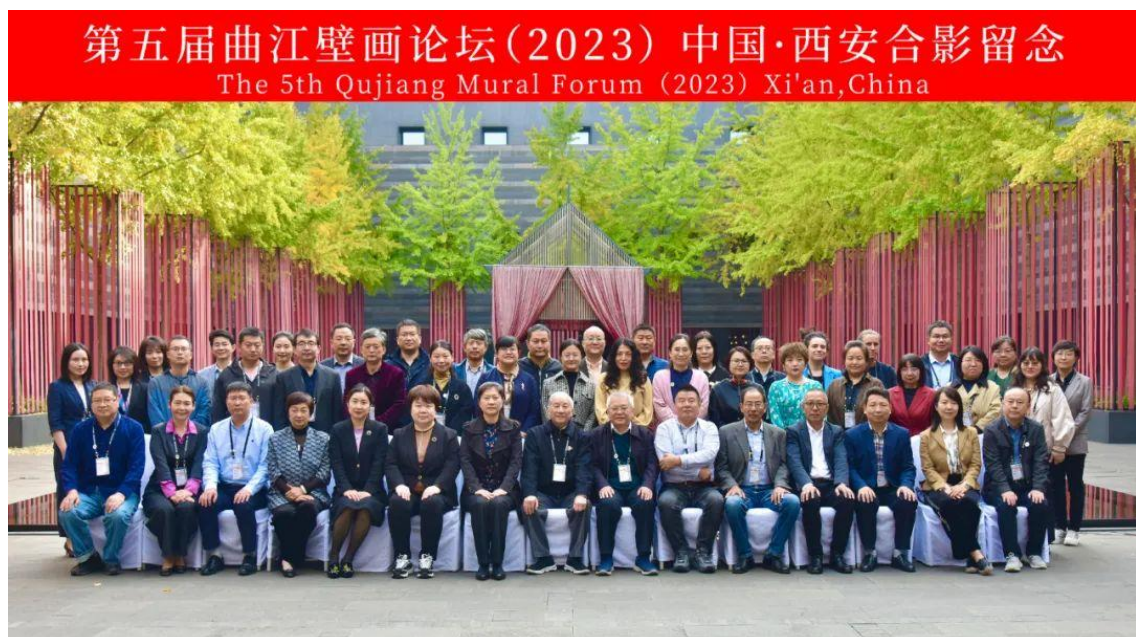
第五届曲江壁画论坛合影留念

1、2023 年 10 月 25 至 27 日，我馆成功举办了第五届曲江壁画论坛，来自意大利、英国、斯洛文尼亚及国内 15 个省（直辖市）文博、高校研究机构的 60 余位专家齐聚曲江，从不同角度围绕图像史研究诠释、壁画保护修复技术分享了各自研究领域内的最新成果，并就当下的壁画艺术史研究及壁画保护修复等课题提出了具有前瞻性的建议与设想。