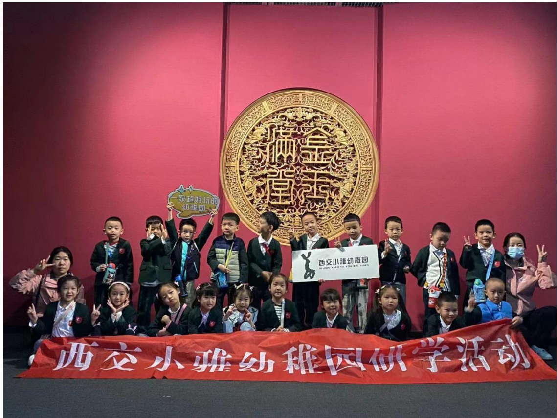
西交小雅幼稚园来我馆进行研学活动