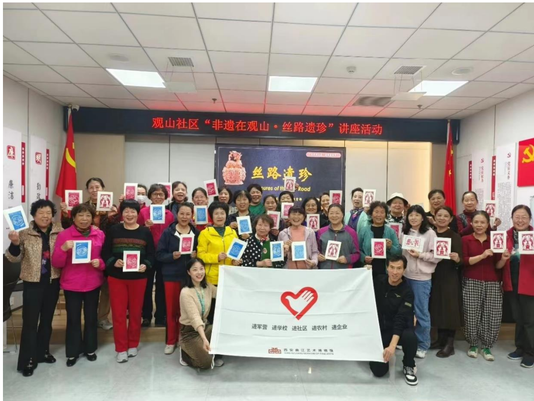
“五进”工作——走进韦曲街道观山社区