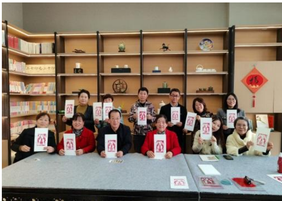
“五进”工作——走进西安高新区高望路社区

我馆高度重视“五进”工作，将博物馆的文化内容输送到学校、社区、军营、农村、企业等。本年度共进行8场“五进”专项活动并获得一致好评。先后走进了上海市浦东新区第二中心小学、上海市进才小学、银泰曲江店、西安雁塔区金泰假日花城小学、西安高新区高望路社区等学校、社区教育场所。持续与线下多个艺术机构合作面向青少年开展美育教育体验活动。