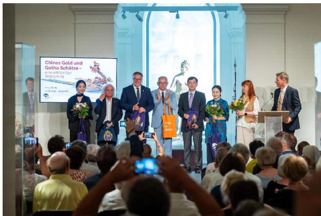
“中国明代金器特展”开幕式

开幕式上，中德多位嘉宾致辞，盛赞展览搭建起东西方文化交流的新桥梁，深化了陕西与图林根的友好省州关系。展览以中国金器与哥达珍宝的“双展联动”为亮点，在哥达公爵博物馆上演跨越时空的文化对话，彰显人类文明在多元交流中的共通价值。本次特展的成功举办，标志着西安曲江艺术博物馆“文化出海”工作再结硕果，也为中德民间文化艺术交流谱写了新的篇章。