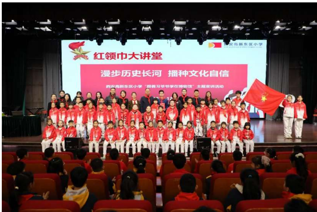
“五进”活动——走进西安高新东区小学

本年度我馆“五进”活动提质增量，创新成效显著。全年累计完成活动 22 场，深化与市委宣传部文明办合作，高效解决活动经费、人员调配、场地协调等核心难题，推动活动在数量、规模与影响力上实现质的飞跃。活动地域覆盖西安碑林区、长安区、雁塔区等核心区域，延伸至上海浦东新区，实现文博资源跨区域、多层次覆盖。