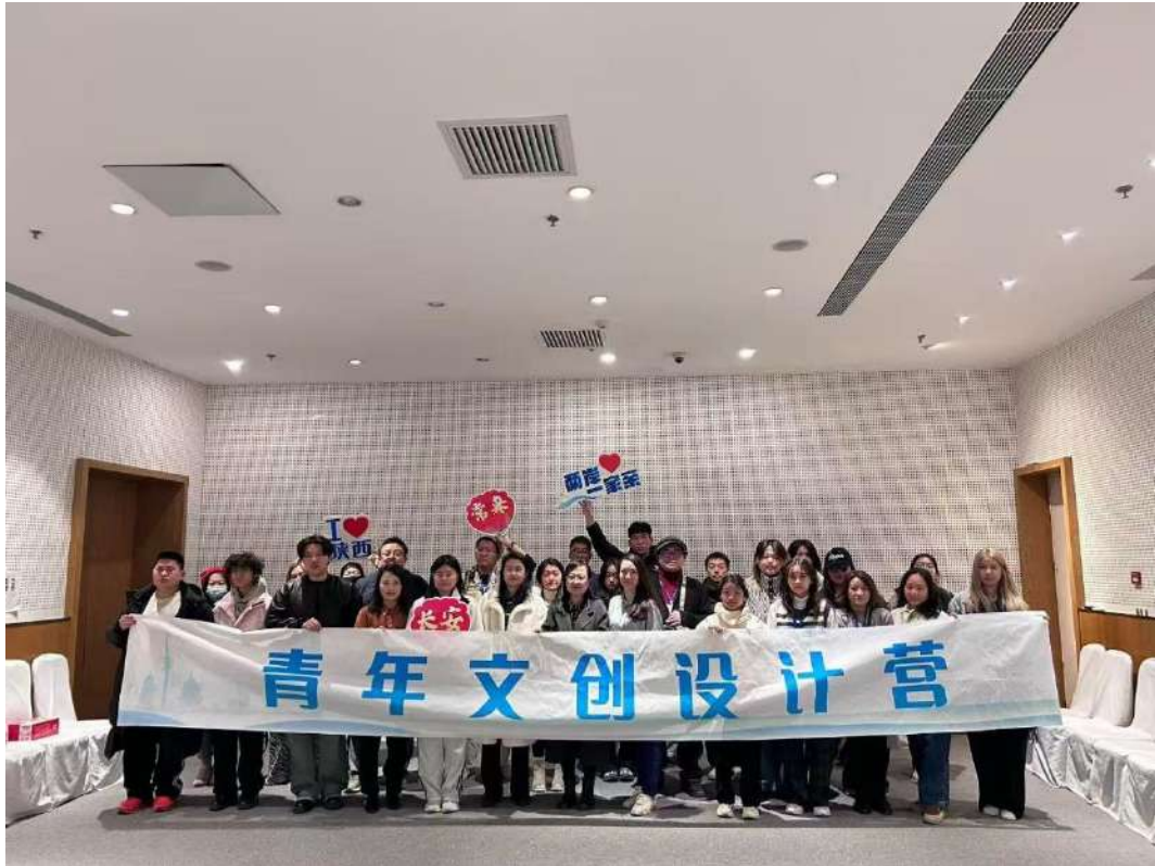
台湾“青年文创设计营”营员来我馆参观交流